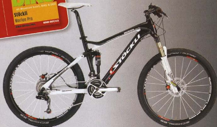
STÖCKLI-BIKE MORION 7 Modelle ab CHF 2'399.-