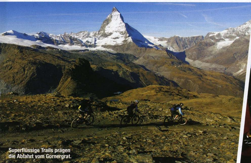
Superflüssige Trails prägen die Abfahrt vom Gornergrat.