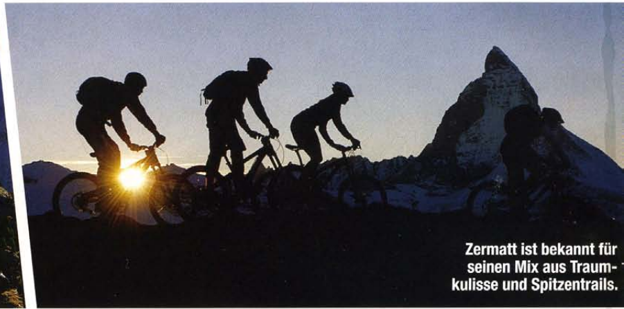
Zermatt ist bekannt für seinen Mix aus Traumkulisse und Spitzentrails.

meer von Zermatt, darüber ein sternklarer Nachthimmel und am Horizont die mächtige Silhouette des Matterhorns.